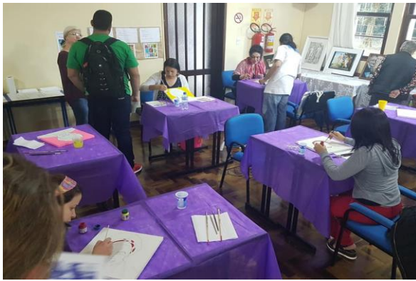
Espaço de pintura