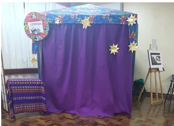
Espaço de cinema