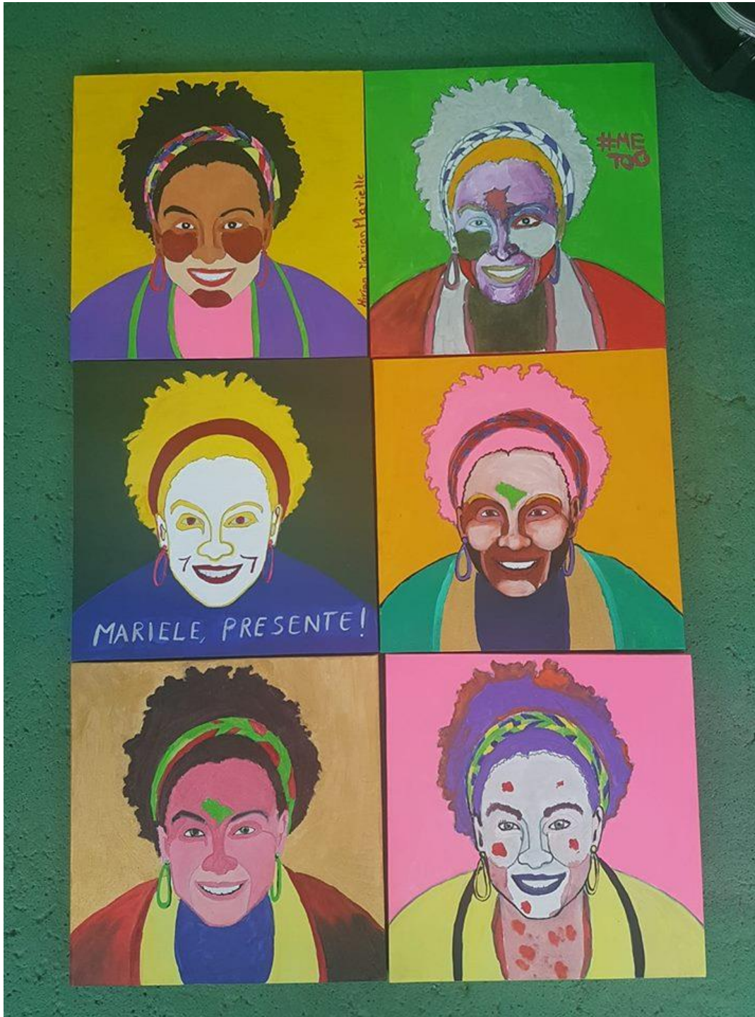
Montagem com pinturas