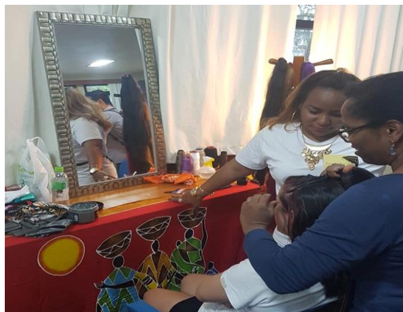
Espaço de tranças