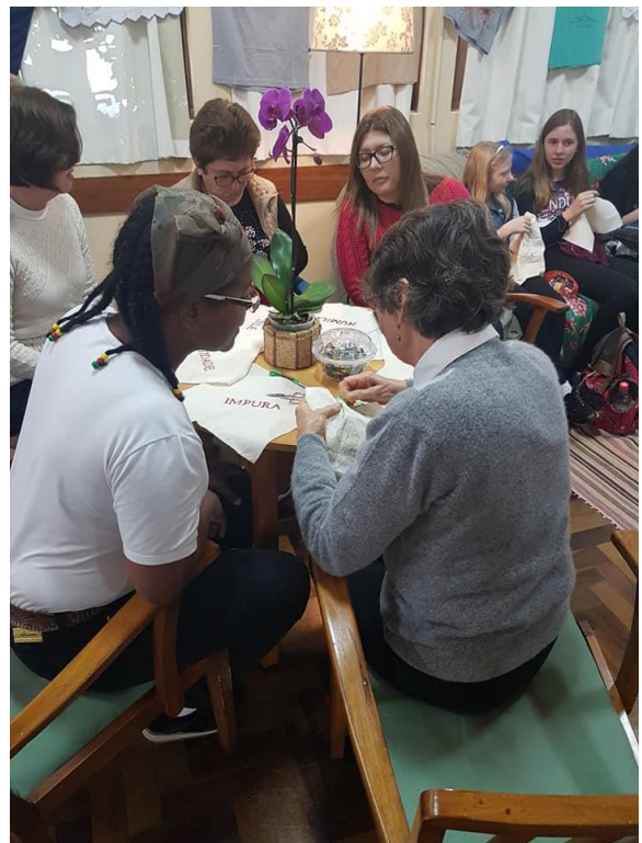
Espaço de bordado