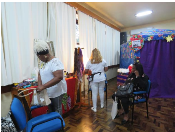
Espaço de tranças