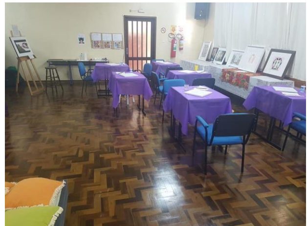
Espaço de pintura