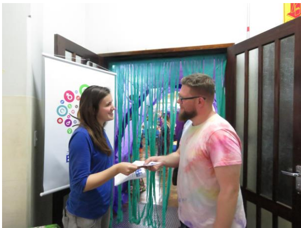
Recepção e entrega do "guia"