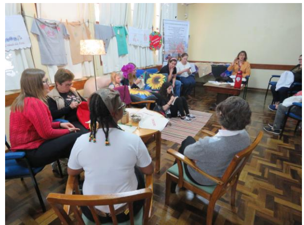
Espaço de bordado