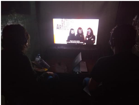
Espaço de cinema