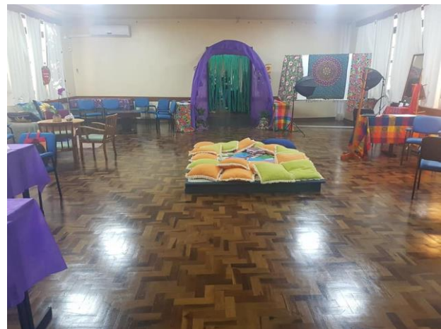
Visão geral do layout do espaço de experimentação