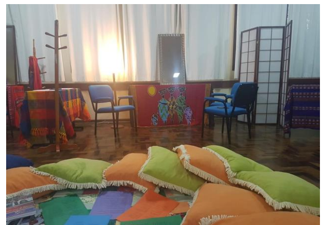
Espaço de tranças