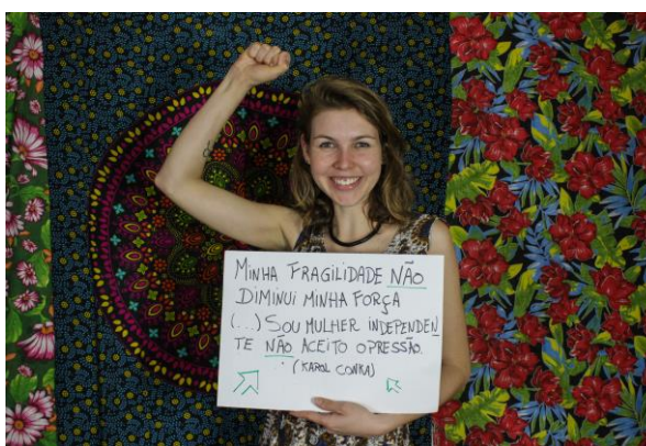
Espaço de música e fotografia