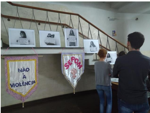
Exposição "Música: Uma construção de gênero" no corredor de entrada

As imagens, a seguir, retratam um pouco do que foi essa experimentação estética.