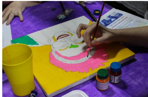
Espaço de pintura