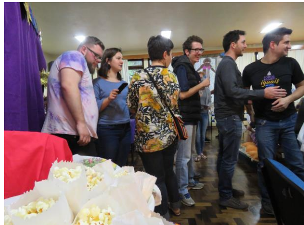
Espaço de cinema