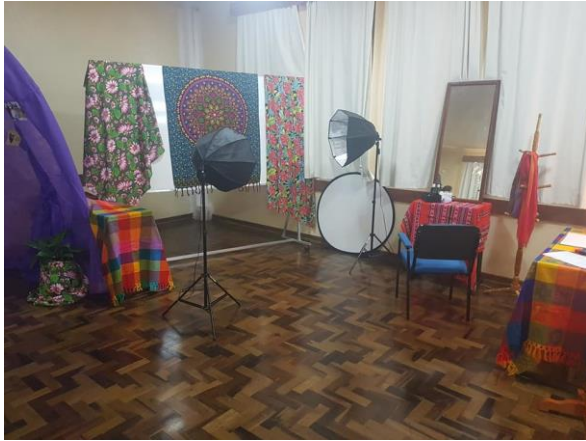
Espaço de música e fotografia