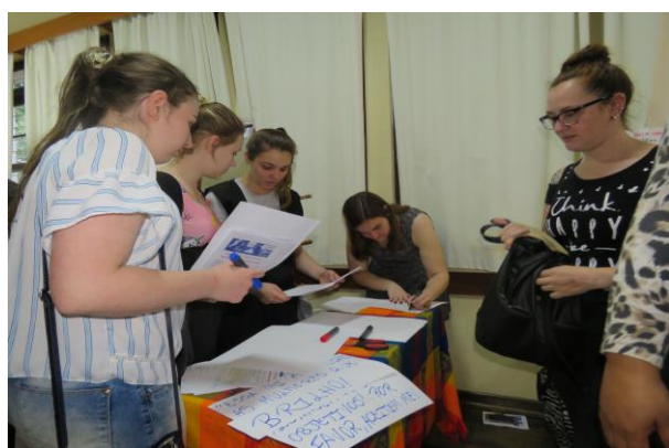
Espaço de música e fotografia