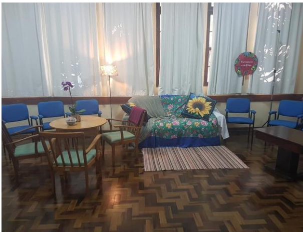
Espaço de bordado