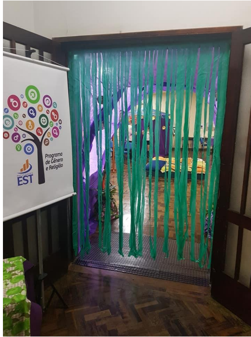
Túnel de entrada (visão externa)