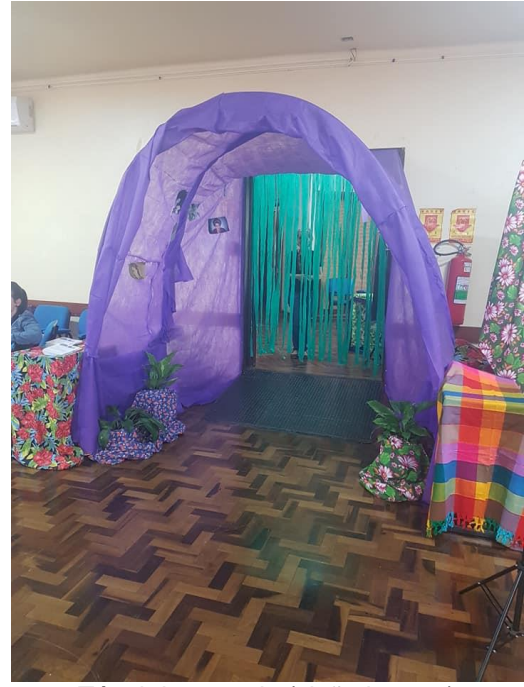
Túnel de entrada (visão interna)