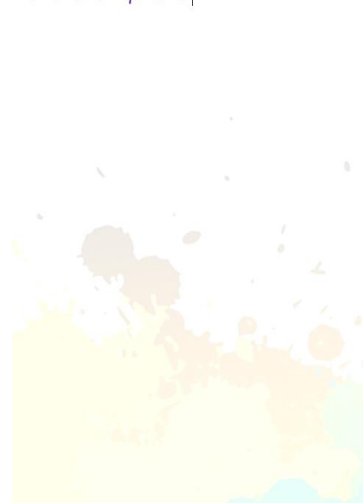
Ficha do Guia de experimentação